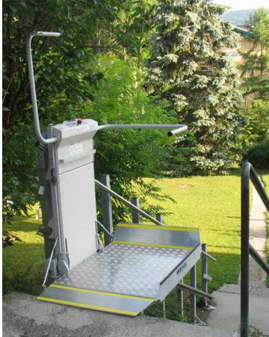
Robuste Plattformmechanik erlaubt eine Installation in sehr kalter oder feuchter Umgebung

Vollautomatische Plattformfunktionen und ergonomische Befehlsgeber erlauben eine einfache und komfortable Bedienung.