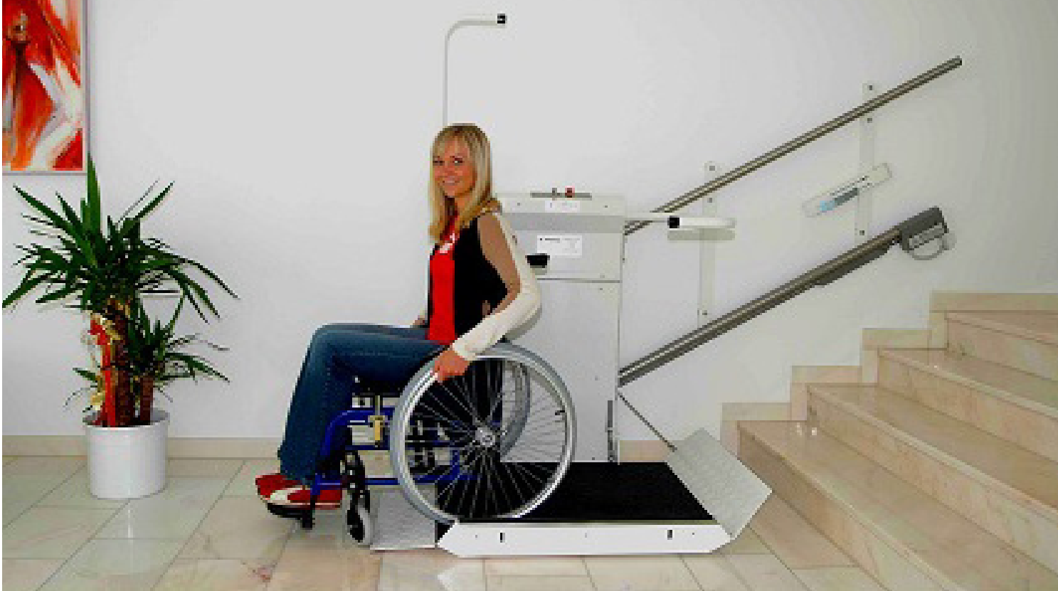
Elegantes und modernes Liftdesign für hohe Ansprüche